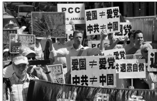
巴黎大游行，声援一亿多中国人三退