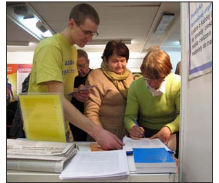
图：波兰民众签名反对中共迫害

台上索取相关资料，法轮功学员为此准备了波兰语、英文、德文、法文和中文等多语种法轮大法传单，让更多的人了解法轮大法。◇