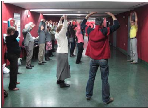
图：波兰民众学炼法轮功