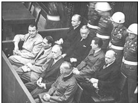
图：纽伦堡审判图片。1945 年二战结束后，纽伦堡国际军事法庭否决了迫害帮凶们“奉命行事”的辩解。

二零零九年二月，由联合国推动的群体灭绝案法庭在柬埔寨首都正式开庭，以战争罪、反人类罪、酷刑及谋杀罪指控，开始对前波尔布特共