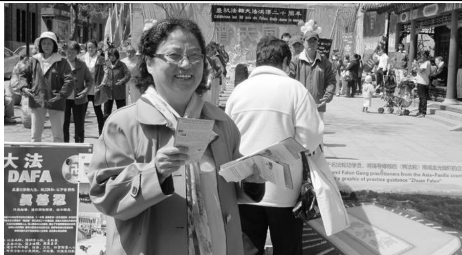
图：蒙特利尔庆祝法轮大法传习二十周年，七十多岁的金女士在发真相资料。