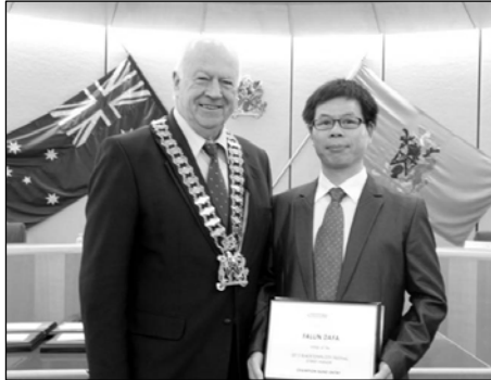
图：市长（左）在市政府议员会议上为法轮功团体代表颁奖

布莱克市市长艾伦·彭德尔顿说：“法轮大法的游行队伍一直是很棒的！我觉得非常壮观，色彩绚丽。他们是一群很好的人。”