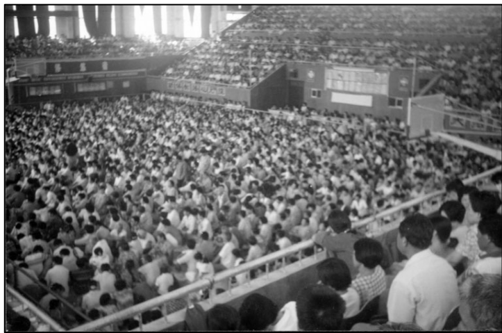
图：一九九八年八月份，来自青岛、潍坊、即墨、平度、莱阳、栖霞、海阳等地的四千五百多人在山东省莱西市体育馆内举行了法轮大法修炼心得交流会。整个体育馆内座无虚席，会场充满了祥和、慈悲。

因为当时家里人都知道我要回家，可是连着一周的时间就是找不到我，父母都要上济南去找我了。后来我跟家人说起这事的时候，奶奶特意嘱咐我：当时电话联系不到你的时候，我跟你妈就怕你被黑社会给害死了，就经常掉眼泪，现在你回来了，我们都高兴，你可别忘了那些帮助过你的人啊。我答应着。