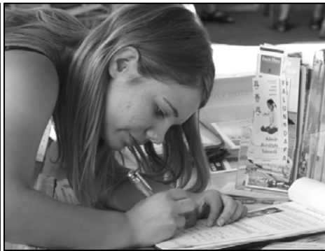
图：德国多个城市熙熙攘攘的人群纷纷签名，支持法轮功学员反迫害