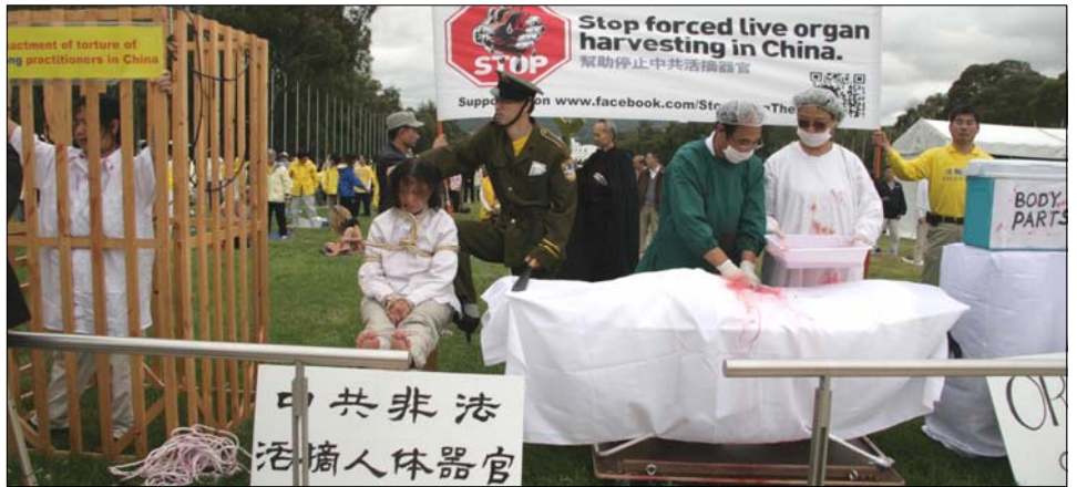
图：国会大厦前模拟演示，揭露中共酷刑迫害法轮功学员并活体摘取器官。

来自美国的智库研究员伊森·葛特曼先生是作家及研究者，也是调查法轮功学员和其他一些政治犯被中共活摘器官的主要独立调查员之一，同时是《失去新中国》一书的作者及《亚洲华尔街日报》等刊物的撰稿人。他与悉尼大学药理学和运动科学教授菲尔特罗内·辛格在研讨会上就中共谋杀法轮功学员，非法摘取和出售他们器官的指控及对指控进行的调查做了详尽的介绍。