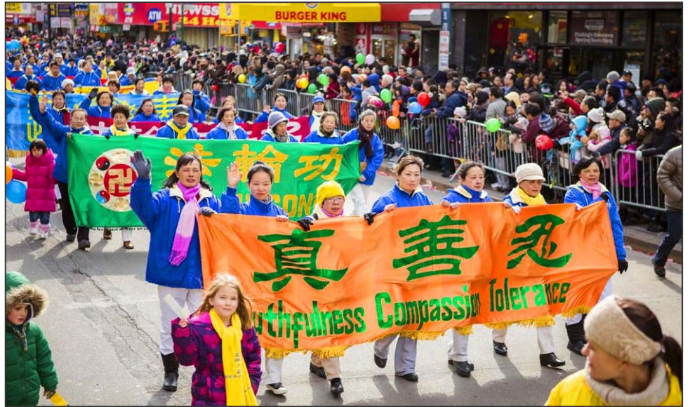
图：纽约法拉盛新年游行，法轮功队伍受到民众欢迎。

大年初八，悉尼市政府一年一度的“中国新年花灯巡游庆典”吸引超过十万观众沿街观看，天国乐团雄壮