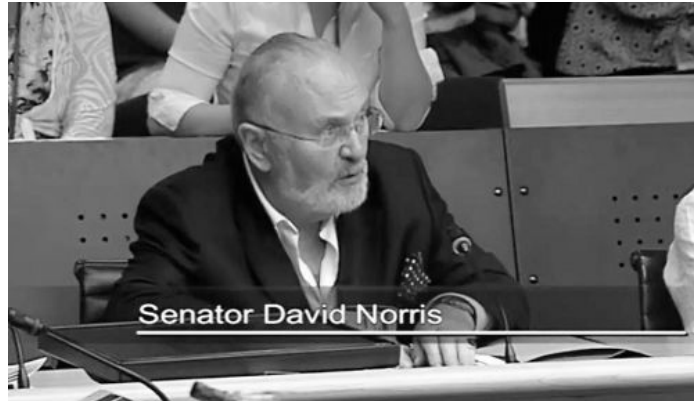
爱尔兰参议员大卫·诺瑞斯在听证会上提出阻止活摘法轮功学员器官的决议以及立法的议案