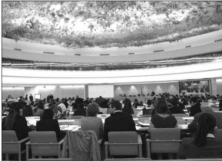
第二十四届联合国人权理事会大会在日内瓦召开