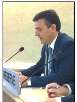
西班牙人权律师 Carlos Iglésias 在联合国人权会议上发言