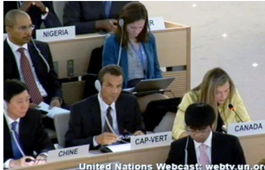
加拿大代表（右一）在聯合國會議上再次提出中共迫害法輪功等問題。

今年六月七日，加拿大主流媒體《環球郵報》刊登文章《新的宗教自由監督面臨艱苦戰鬥》，披露今年二月，加拿大總理在宗教自由辦公室正式成立時，譴責了中共的宗教迫害，包括對法輪功的迫害。《環球郵報》引用宗教自由辦公室大使班尼特的話說：「我們將繼續在宗教迫害方面表