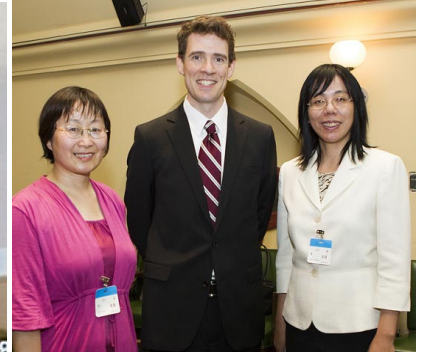
右圖：加拿大宗教自由辦公室大使安德魯·班尼特先生和法輪功學員合影。

達我們的看法，我對他（中共駐加拿大大使章均賽）說，到時，我將與藏傳佛教、法輪功、基督教群體進行會談。」今年五月中旬，班尼特先生會見了加拿大法輪大法學會成員，了解了中共對法輪功的迫害情況。