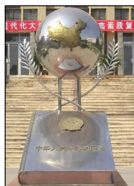
圖左：中共酷刑折磨法輪功學員，同時掩蓋罪行。圖中：國際獲獎記錄片《偽火》揭露了「天安門自焚」假案是中共導演的。中宣部製造了大量假新聞煽動民眾仇恨，為中共迫害法輪功鋪路。圖右：「憲法頂個球」——當年的陝西省西北政法大學雕塑。中共迫害法輪功無任何法律依據。