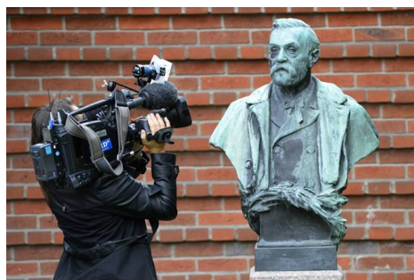
一位攝影師在拍攝諾貝爾雕像

擺脫「人質情結」才會看到事實真相。法輪功學員的「4.25」上訪和他們的講真相，是在維護做好人、講真話的基本權利，是在維護每一個中國人的合法權利。（文／華雲）◇