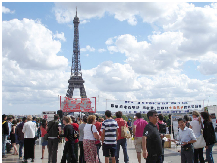
巴黎埃菲尔铁塔下，法轮功学员常年坚持讲真相，帮助中国游客“三退”

最近，来欧洲景点的中国大陆游客，最热的话题就是雾霾。他们说，在欧洲转了几个国家，都没见到雾霾天，而且秋高气爽，气候宜人，特别是喘气舒畅。大陆游客说：“看来，雾霾天是中国特色，唯独中国才有。”