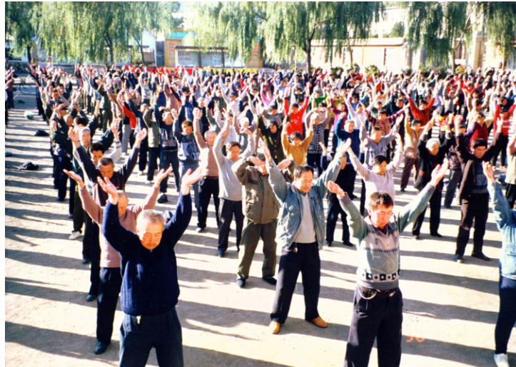
99年迫害前，辽宁凌源市大法弟子集体炼功

三十多年的佛教净土修炼中，大姐陆续帮助过不少人，但从来不允许别人把她的事情跟其他人讲，也坚决不收受任何人的钱财。她曾开玩笑地说：如果当时收钱，可能早就是百万富翁了！这也证明，一个真正修