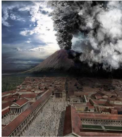
油画：庞贝火山喷发