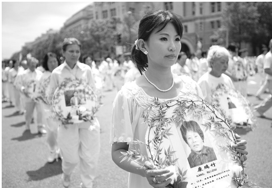
海外反迫害大游行，纪念被中共迫害致死的法轮功学员。