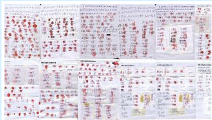
已有 897 位鄉親簽名、按手印，呼籲立即釋放好人葛秀麗。