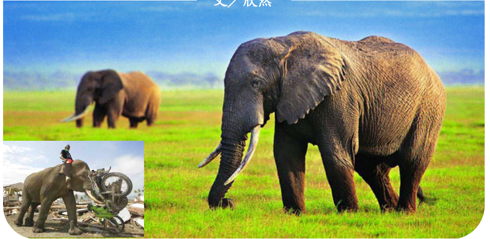
小圖：南亞大海嘯重災區，一頭大象用鼻子捲起摩托車，幫助清理廢墟。

2002 年 6 月，貴州省平塘縣掌布鄉「藏字石」現世。巨石斷面顯現出六個大字「中國共產黨亡」，媒體報導，經多批中國最權威的地質、古生物專家考證，石齡已有 2.7 億年，字乃海綿、海百合莖、腕足類等古生物化石「渾然天成」。