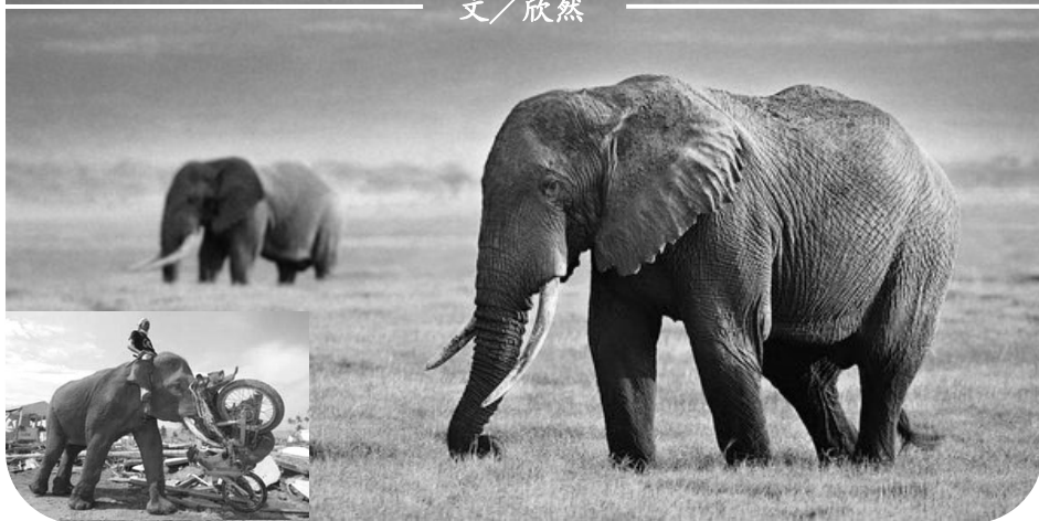
小图：南亚大海啸重灾区，一头大象用鼻子卷起摩托车，帮助清理废墟。

2002年6月，贵州省平塘县掌布乡“藏字石”现世。巨石断面显现出六个大字“中国共产党亡”，媒体报道，经多批中国最权威的地质、古生物专家考证，石龄已有2.7亿年，字乃海绵、海百合茎、腕足类等古生物化石“浑然天成”。