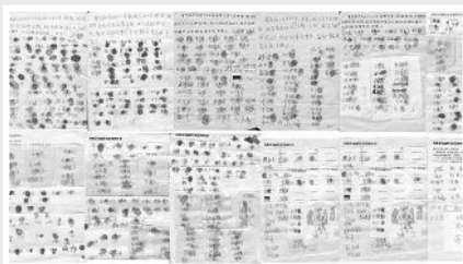
已有 897 位乡亲签名、按手印，呼吁立即释放好人葛秀丽。