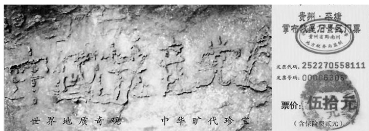
贵州省平塘县掌布乡“藏字石”风景区门票图案

大海啸过后，野生动物专家对路透社记者说：“我们没有找到一具动物尸体……动物也许能感知到这场灾难，它们有第六感。它们了解要发生的事情。”