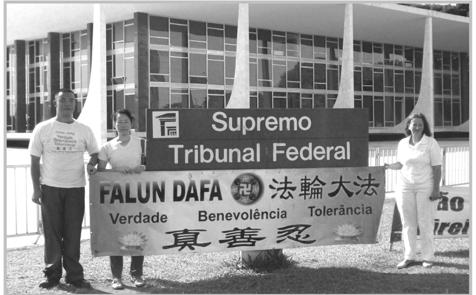
2014 年 2 月，巴西最高法院机构前的法轮功真相横幅。

巴西首都司法部的律师、法官们阅读真相资料后，对这场迫害感到震惊，无法理解中共的暴行。在科技开发部门口，一位保安负责人表示：敬仰神佛是人类正确的行为，绝不能被