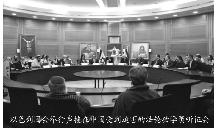
以色列国会举行声援在中国受到迫害的法轮功学员听证会

近两周以来，以色列社会十余家主流媒体连续报道法轮功受迫害和中共强摘法轮功学员器官的相关话题。