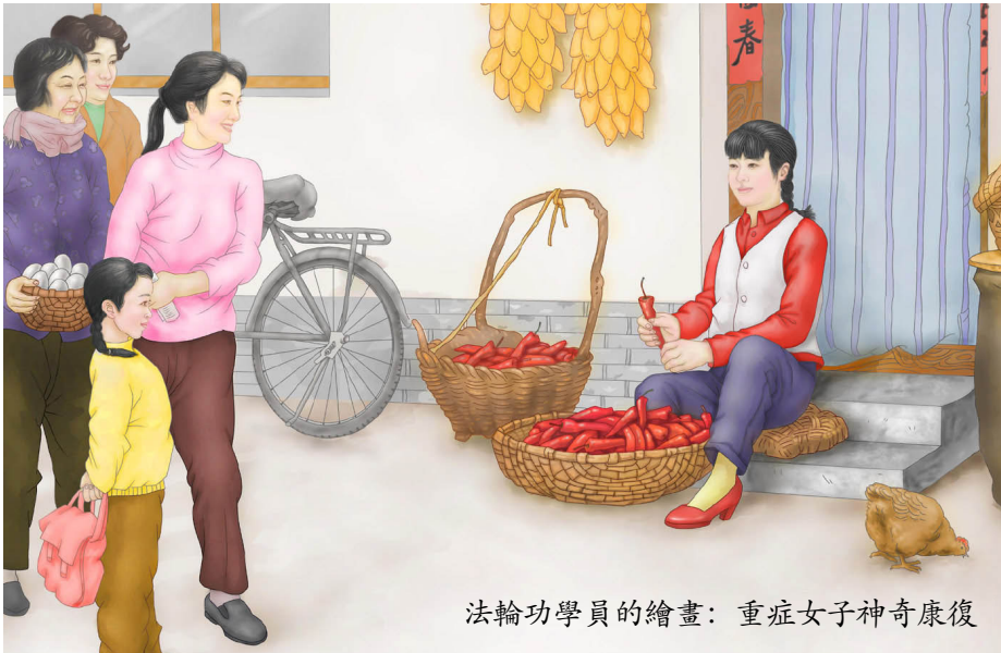
法輪功學員的繪畫：重症女子神奇康復