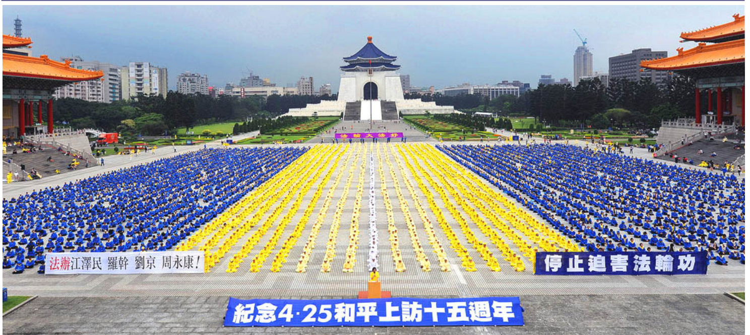
2014 年 4 月 26 日，近 6000 名法輪功學員在臺北自由廣場紀念「4·25」和平上訪 15 週年，呼籲制止中共迫害，法辦迫害元凶。