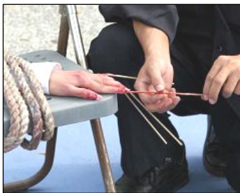
酷刑演示：竹籤釘指甲