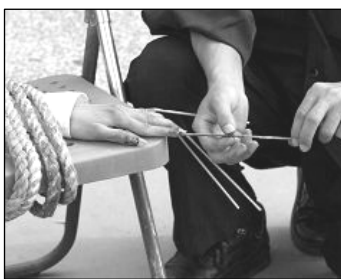
酷刑演示：竹签钉指甲