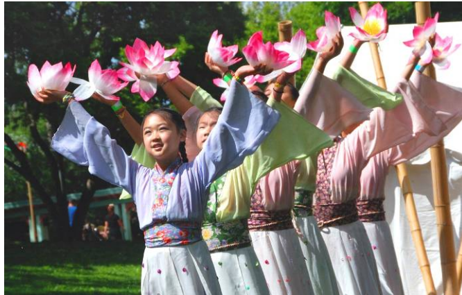
美國費城明慧學校的學生應邀在亞裔文化節上表演舞蹈

謊言教育。很多大陸小學在早上學生入校時，還見縫插針地播放所謂愛國（其實是愛黨）歌曲，比如《共產主義接班人》、《五星紅旗迎風飄揚》等等。