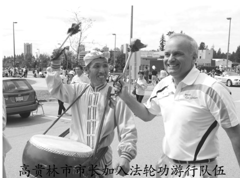
高贵林市市长加入法轮功游行队伍

【明慧网】2014 年 6 月 8 日, 加拿大温哥华法轮大法学员参加了高贵林市 (Coquitlam) “泰迪熊节”游行, 受到观众热烈欢迎。高贵林市