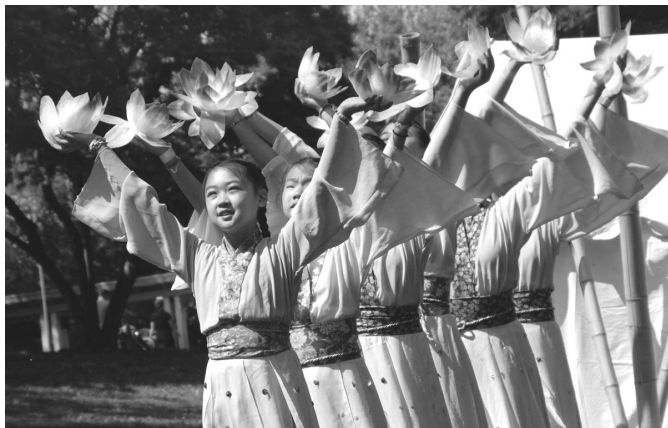
美国费城明慧学校的学生应邀在亚裔文化节上表演舞蹈

谎言教育。很多大陆小学在早上学生入校时，还见缝插针地播放所谓爱国（其实是爱党）歌曲，比如《共产主义接班人》、《五星红旗迎风飘扬》等等。