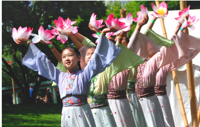
美国费城明慧学校的学生应邀在亚裔文化节上表演舞蹈

谎言教育。很多大陆小学在早上学生入校时，还见缝插针地播放所谓爱国（其实是爱党）歌曲，比如《共产主义接班人》、《五星红旗迎风飘扬》等等。