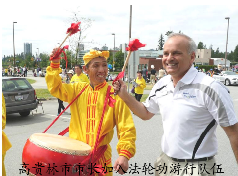
高贵林市市长加入法轮功游行队伍

【明慧网】2014 年 6 月 8 日, 加拿大温哥华法轮大法学员参加了高贵林市 (Coquitlam) “泰迪熊节”游行, 受到观众热烈欢迎。高贵林市