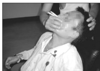
中图：酷刑演示：将两根香烟同时点着、插入鼻孔、捂嘴，致使被迫害者熏呛窒息。