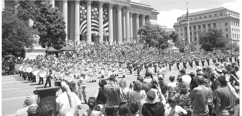
2014 年美国首都国庆游行，观众欢迎法轮功队伍并拍摄这独具特色的场面。

加拿大官方多次在联合国人权委员会上发言，关注法轮功受迫害及中共强摘器官之事。在公开反对迫害