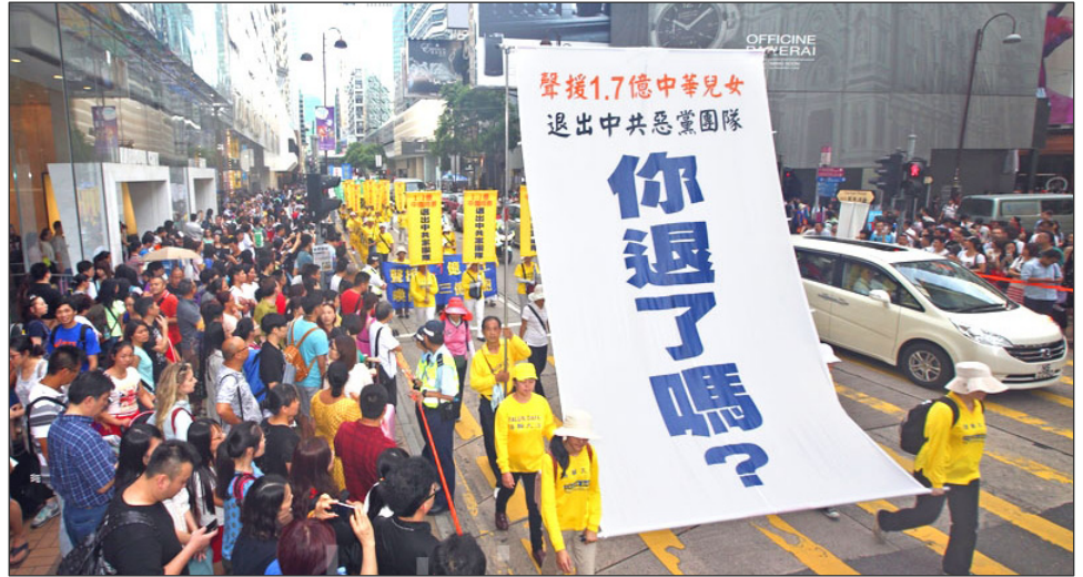
2014 年 7 月 20 日，香港法輪功學員反迫害大遊行。

義為禍中華近百年，中共建政後，發動歷次運動，八千萬中國人被迫害致死，使中華大地生靈塗炭。