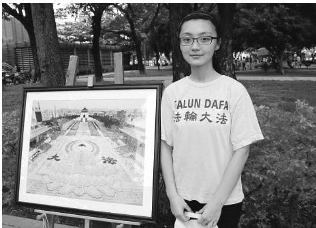
昕芸在高雄参加讲真相活动（2014年7月20日）

“法轮大法让我重新看到生命的希望，是我生命中的曙光。因为修炼大法，我读书更认真。我们家因为修炼大法而和谐快乐。”◇