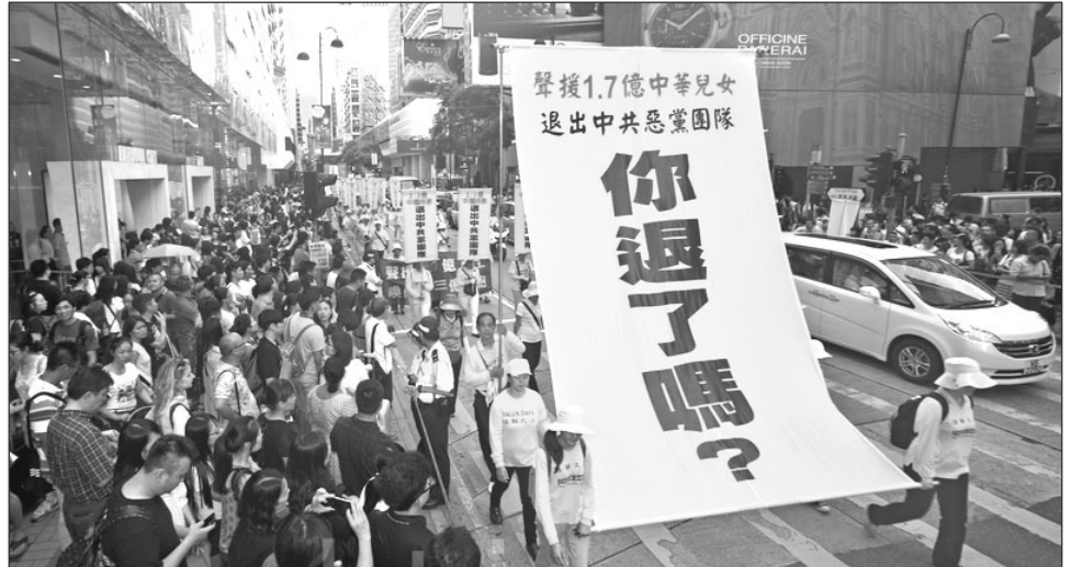
2014 年 7 月 20 日，香港法轮功学员反迫害大游行。

产主义为祸中华近百年，中共建政后，发动历次运动，八千万中国人被迫害致死，使中华大地生灵涂炭。