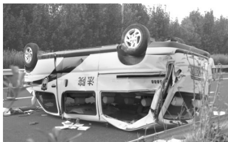
鲁山县法院的金杯警车四轮朝天