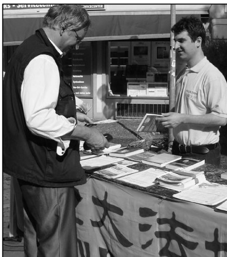
蒙丁传播法轮功真相

通过修炼他感到身体很好，通过专注地阅读法轮功书籍，他感到内心的平静，身体充满了能量。“哪怕我