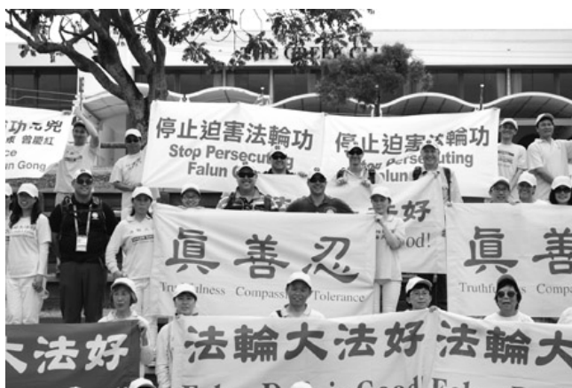
游行结束时，数名警察主动和学员们大合照

◎2014 年 11 月，澳洲 20 国集团峰会（G20）期间，澳洲法轮功学员们以理性、平和的方式呼吁停止发生在中国的迫害，深深感动了澳洲警察，他们全程保护学员，并帮助排除中共使馆的干扰。活