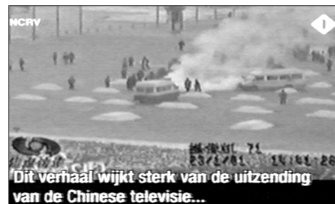
图:荷兰国家电视台 2005 年 3 月 14 日《时事评论》节目揭露“天安门自焚”伪案,质疑突发事件中两辆警车为何备有(据中共报导)20 多个灭火器。国际教育发展组织 2001 年 8 月 14 日在联合国会议上声明:整个自焚事件是政府导演的。中国代表团面对确凿证据,没有辩辞。

第二天一大早,女孩把我拉到没人的地方,硬要给我 100 元钱,让我转交给做资料的人。她说:你们大法弟子太伟大了,身处魔难,却省吃俭用地攒钱做资料救人,不图回报,我居然把台历撕了,太对不起你们法轮