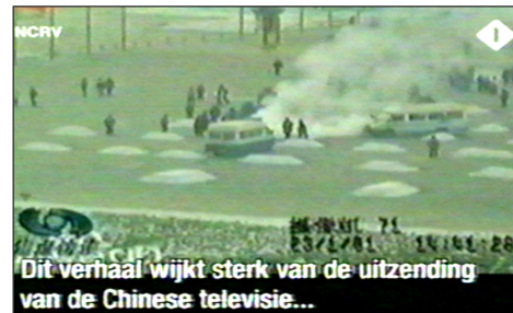
图:荷兰国家电视一台 2005 年 3 月 14 日《时事评论》节目揭露“天安门自焚”伪案,质疑突发事件中两辆警车为何备有(据中共报导)20 多个灭火器。国际教育发展组织 2001 年 8 月 14 日在联合国会议上声明:整个自焚事件是政府导演的。中国代表团面对确凿证据,没有辩辞。

第二天一大早,女孩把我拉到没人的地方,硬要给我 100 元钱,让我转交给做资料的人。她说:你们大法弟子太伟大了,身处魔难,却省吃俭用地攒钱做资料救人,不图回报,我居然把台历撕了,太对不起你们法轮