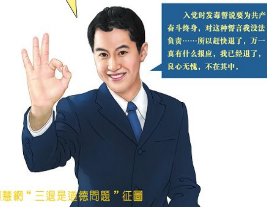
明慧网“三退是道德问题”征图