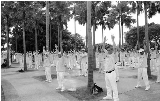
下：法轮功学员在公园广场前集体炼功