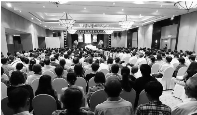
上：马来西亚法轮大法修炼心得交流会现场；

而周永康们的下场也是上天给那些执迷不悟、仍然在迫害法轮功的从犯们的慈悲警示，“你们停止迫害、立功赎罪的机会不多了！”◇