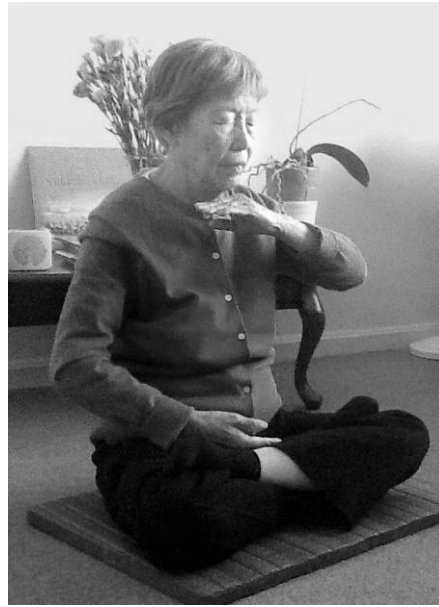
朱女士炼法轮功第五套功法