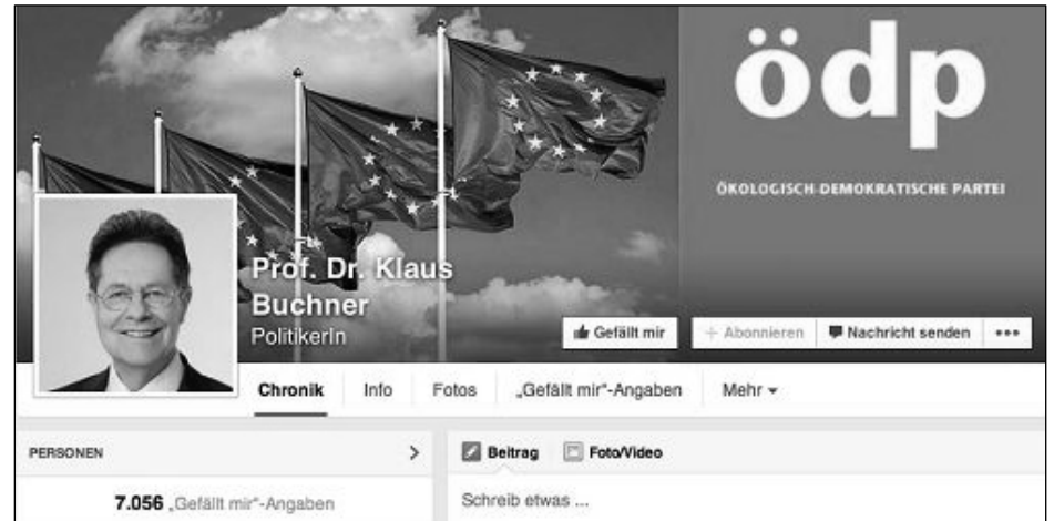
欧洲议会人权委员会议员克劳斯·布赫讷（Klaus Buchner）的脸书截图

第二天，他们遭到建三江市警察绑架，四律师被戴黑头套及酷刑折磨，共被打断 24 根肋骨，唐吉田律师一人被打断 10 根肋骨。他向媒体透露，在被暴打过程中，他被恶警威胁说，要