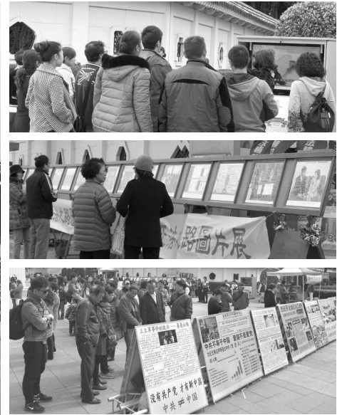
台北法轮功学员炼功 右上图：大陆游客看中共导演的“天安门自焚”假案视频。右中、下图：大陆游客看图片展和真相展板。