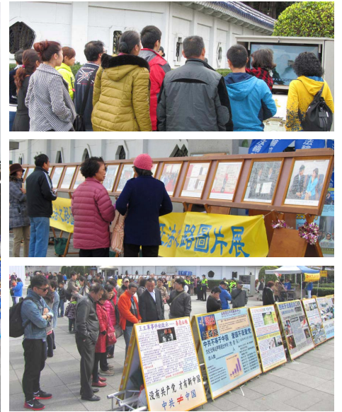
台北法轮功学员炼功 右上图：大陆游客看中共导演的“天安门自焚”假案视频。右中、下图：大陆游客看图片展和真相展板。