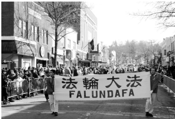
纽约地区法轮大法学员参加长岛亨廷顿游行受欢迎

©2015年3月8日，部分纽约地区法轮大法学员参加了长岛亨廷顿组织的一年一度的圣派翠克节游行，受到当地居民的热烈欢迎。当队伍经过主席台时，游行负责人和州众议员们纷纷高兴地和法轮大法学员握手并表示感谢。有的民众跑到学员的队伍中索要介绍法轮功的真相资料，还有的人向大法弟子挑起大拇指，有的说：我爱“真善忍”。