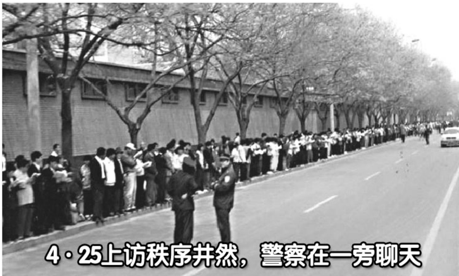
4·25上访秩序井然，警察在一旁聊天