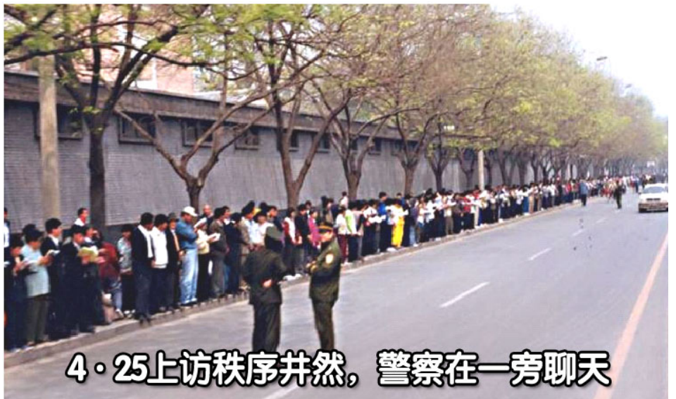
4·25上访秩序井然，警察在一旁聊天