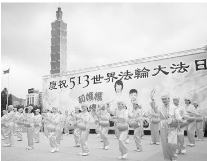
2015 年 5 月 3 日，台北法轮功学员在国父纪念馆户外广场的文艺表演活动