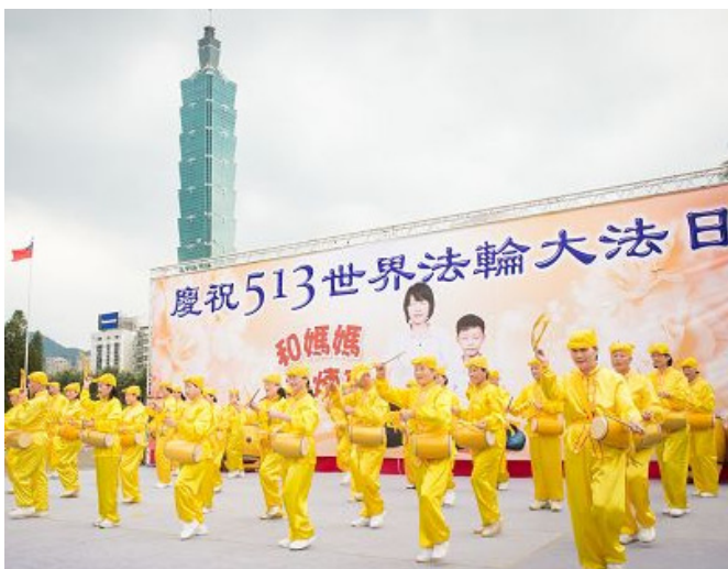
2015 年 5 月 3 日，台北法轮功学员在国父纪念馆户外广场的文艺表演活动