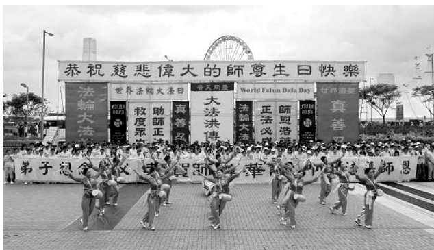
香港法轮功学员庆祝第十六届“世界法轮大法日”

◎2015 年 5 月 13 日是法轮大法弘传 23 周年纪念日、第十六届“世界法轮大法日”和法轮功创始人李洪志先生华诞，各国法轮功学员举行盛大的庆祝活动，中国大陆的法轮功学员和明真相的世人在明慧网上发表上万份贺卡贺辞，诚挚感恩法轮大法。