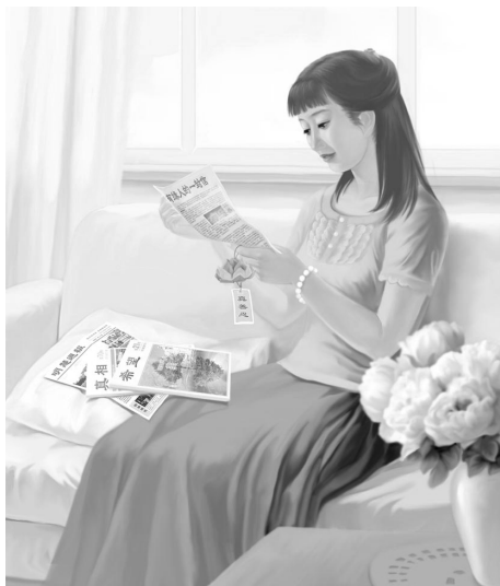
绘画《读真相》 作者：大陆大法弟子

我递给她纸巾，温和地说：“别听电视的谎言，那个杀女儿的不是法轮功学员。你看我会杀小陆吗？”她瞪大眼睛看着我，破涕为笑：“不会！”她也觉得要说我杀人是可笑的事。