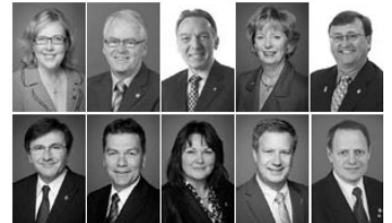
国会议员贺法轮大法弘传 23 周年