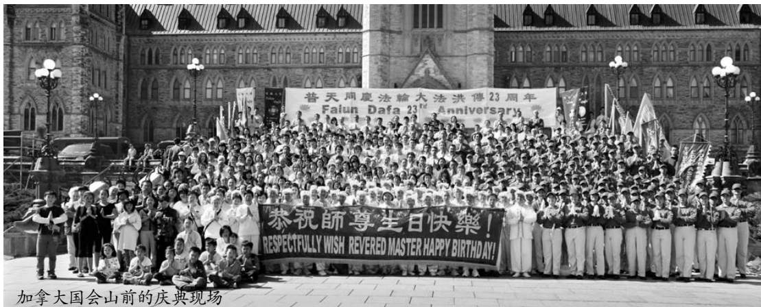
加拿大国会山前的庆典现场