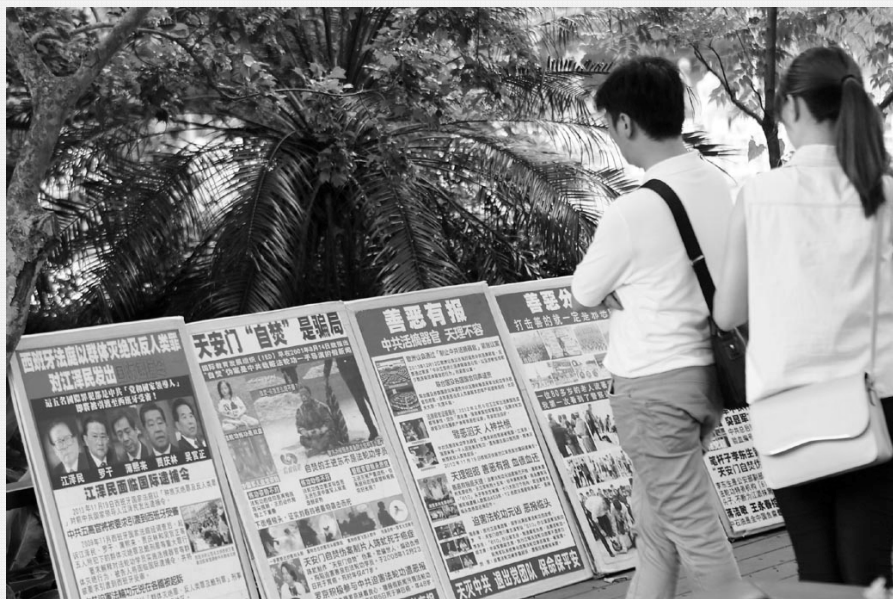
台湾慈湖风光旖旎，是许多大陆游客的必经之地，那里的法轮功真相展板也成了大陆游客平日难得一见的风景。图为游客在看“天安门自焚是中共导演的骗局”、“江泽民迫害法轮功 面临国际逮捕”等真相。（摄于 2015 年 5 月 3 日）

佛光涤荡正苍穹， 春到人间暖意浓。 真相润成三月雨， 善言敲响五更钟。 人心唤醒迎新日， 花木绽萌换旧容。 大法洪恩人得救， 慈悲普度化春风。