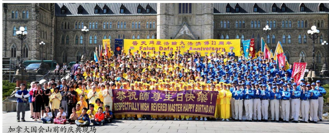
加拿大国会山前的庆典现场