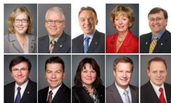
国会议员贺法轮大法弘传 23 周年