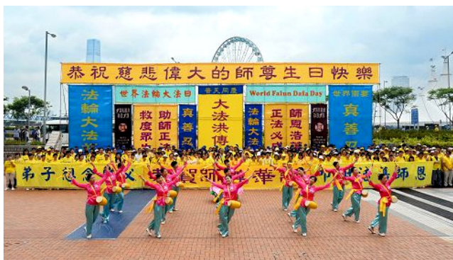
香港法轮功学员庆祝第十六届“世界法轮大法日”

◎2015 年 5 月 13 日是法轮大法弘传 23 周年纪念日、第十六届“世界法轮大法日”和法轮功创始人李洪志先生华诞，各国法轮功学员举行盛大的庆祝活动，中国大陆的法轮功学员和明真相的世人在明慧网上发表上万份贺卡贺辞，诚挚感恩法轮大法。