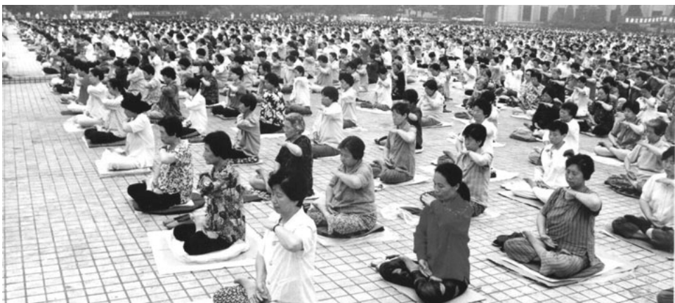
图：1998年5月，沈阳万名法轮功学员集体炼功

饭，四个菜，大家随意凑够十人就开始吃，吃完每个人放下6元钱静静地离开。也就半个多小时，一千多人全吃完饭离开了。