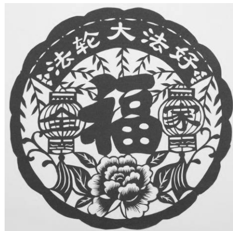
图：剪纸作品《法轮大法好》

虽然迫害还在继续，但像我这样糊涂的人都能醒悟，并能得到如此巨大的福报，大家想一想，这场迫害还能维持多久？◇