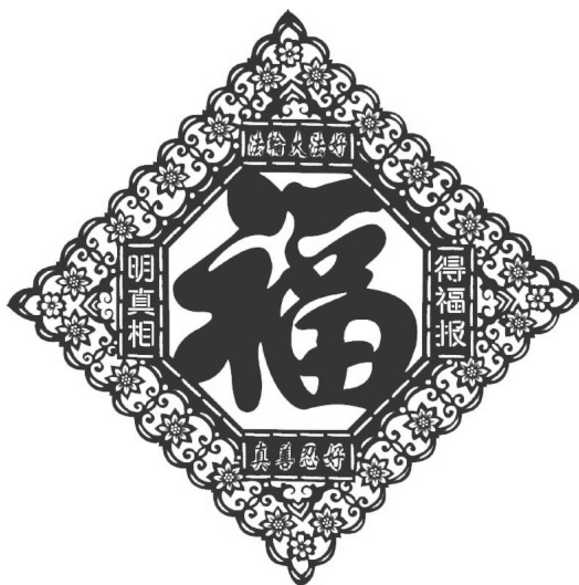
剪纸作品《法轮大法好》

虑我。我把窗户关上，烟就不会往屋里跑了。”听了这话，老俩口松了一口气，露出了笑容，并把我请进屋，又是沏茶又是拿水果。