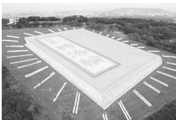
是数千名法轮功学员台湾集体炼功，排组《转法轮》书籍模型。（2009年）

我激动地大喊：“法轮功是神功！法轮大法果然好！”老伴看到我高兴的样子，也眼红地说：“我有好多老病，我也要修炼！”