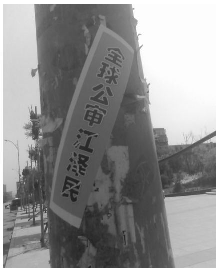
2015 年 5 月，云南昆明某公园内的“全球公审江泽民”标语（左图），辽宁一城市出现“全球公审江泽民”等标语（右图）。

造的滔天罪恶，是使江泽民之后的历届当政者都不敢向国际社会承认，不敢向全国百姓交代的罪大恶极之事。也是招致天灭中共的重要原因。