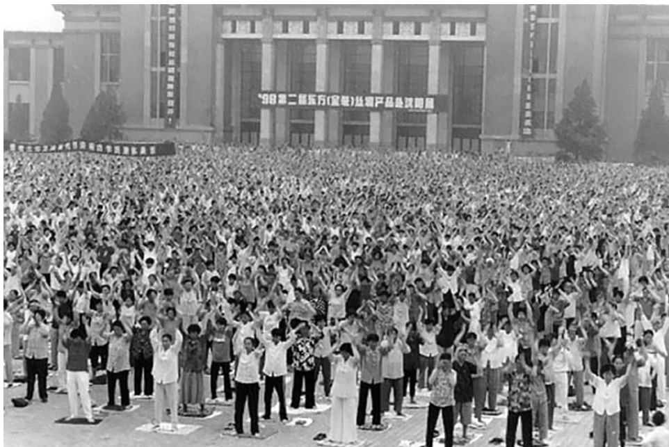
1998年5月的一个星期日早晨，一万多名法轮功学员在沈阳工业展览馆门前的广场上举行了集体晨炼。虽然人数众多，学员彼此互不相识，但秩序井然，没有任何嘈杂、喧闹。万人晨炼结束后地上没留一片纸屑。

我带着一儿一女单过。原来和公婆在一起种的地要分开。当时正赶上夏初，青苗已有一尺来高，但长势不均，有高有矮。我想，公婆年岁大了，种地不容易，就让他们先挑。结果长