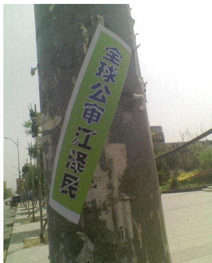
2015 年 5 月，云南昆明某公园内的“全球公审江泽民”标语（左图），辽宁一城市出现“全球公审江泽民”等标语（右图）。

造的滔天罪恶，是使江泽民之后的历届当政者都不敢向国际社会承认，不敢向全国百姓交代的罪大恶极之事。也是招致天灭中共的重要原因。