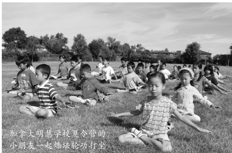
加拿大明慧学校夏令营的小朋友一起炼法轮功打坐

辽宁抚顺市新宾县一派派出所警察，给法轮功学员打电话查询是否写过诉江状，学员给了他肯定的答复。警察最后说：“其实我挺佩服你们的，我打了这么多电话，没有一个不承认的！”◇