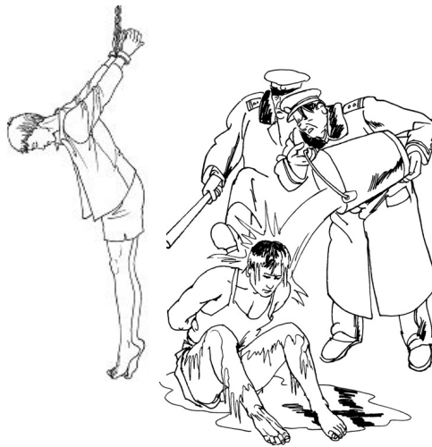
中共酷刑示意图：上绳吊铐；浇冰水

我曾患有心脏、肾炎、肾结石、胆囊炎、严重神经衰弱、胃病、长期失眠等综合疾病，每年报销医疗费 3