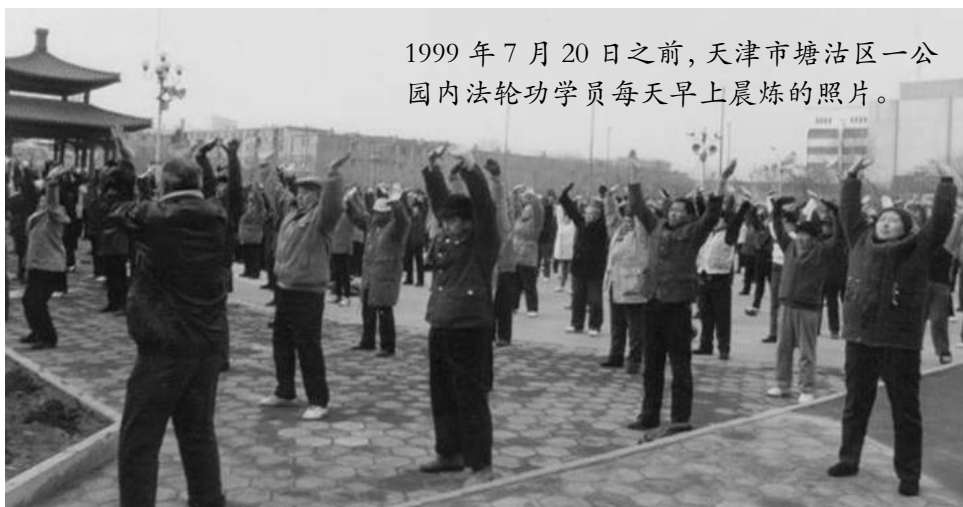
1999 年 7 月 20 日之前，天津市塘沽区一公园内法轮功学员每天早上晨炼的照片。

在院子里大喊：“我满礼堂找罗锅也没找到，原来您自己早回家了……啊！您的腰怎么直了？！”