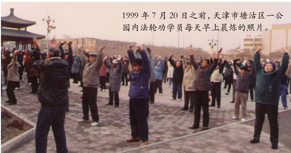
1999 年 7 月 20 日之前，天津市塘沽区一公园内法轮功学员每天早上晨炼的照片。

在院子里大喊：“我满礼堂找罗锅也没找到，原来您自己早回家了……啊！您的腰怎么直了？！”